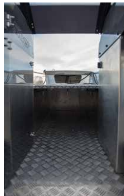
Keulakannen alla on lukitsematonta säilytystilaa ja aivan keulapiikissä hyvä tila esimerkiksi köysille.