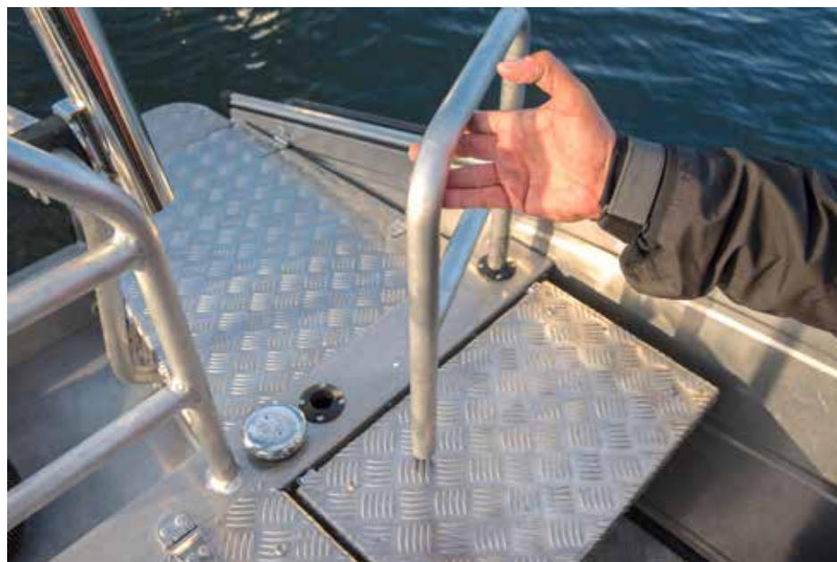
Kaiteet ovat avattavaa mallia. Metallikorkki on 130 litran bensatankin korkki.